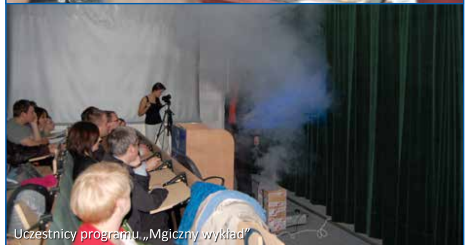
Uczestnicy programu „Mgiczny wykład”