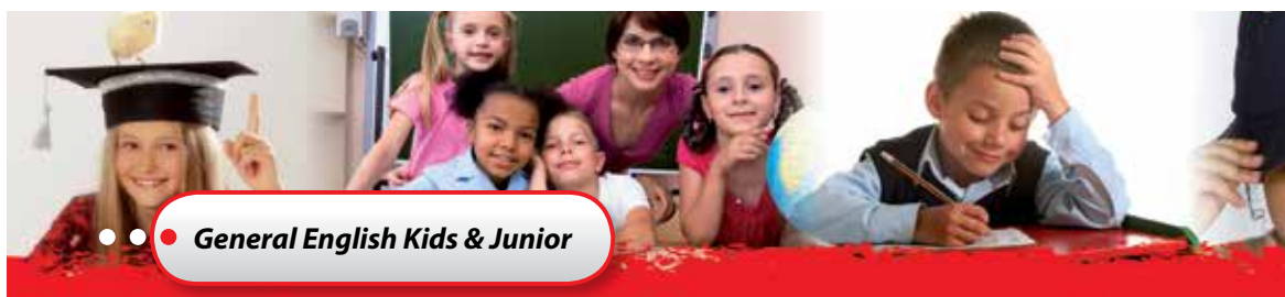
General English Kids &amp; Junior