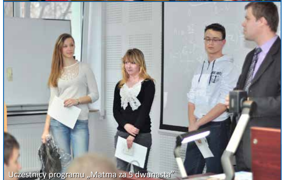
Uczestnicy programu „Matma za 5 dwunasta”