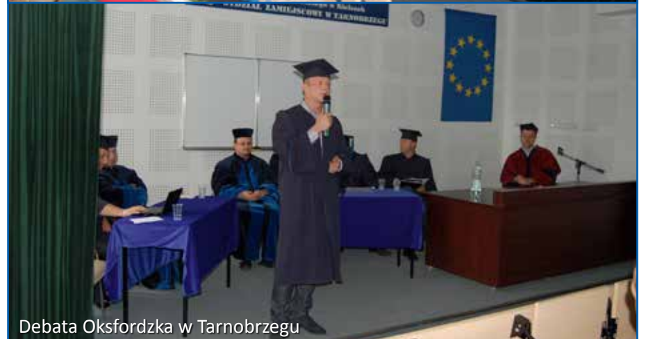
Debata Oksfordzka w Tarnobrzegu