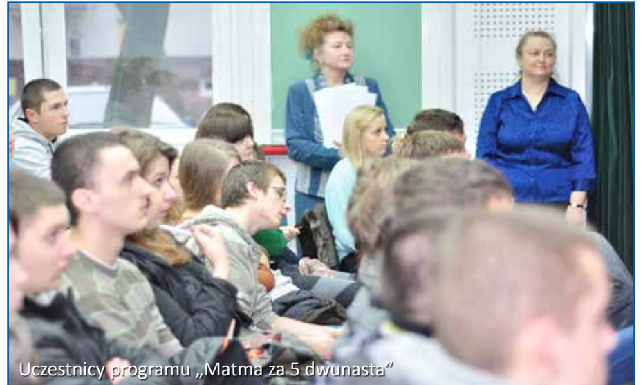
Uczestnicy programu „Matma za 5 dwunasta”

Na pewno przyda się wytrwałość. Konsekwencja w realizacji zamierzonych działań powinna przynieść wymierne efekty, a także inspirować nas do podejmowania kolejnych wyzwań. Jednak niewątpliwie, by udało się to wszystko osiągnąć potrzebne jest zdrowie, czego wszystkim pracownikom uczelni, naszym studentom i sobie również życzę.