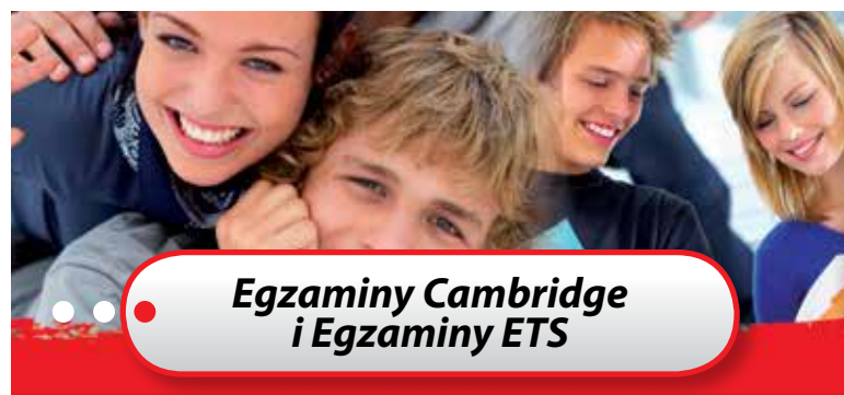
Egzaminy Cambridge i Egzaminy ETS