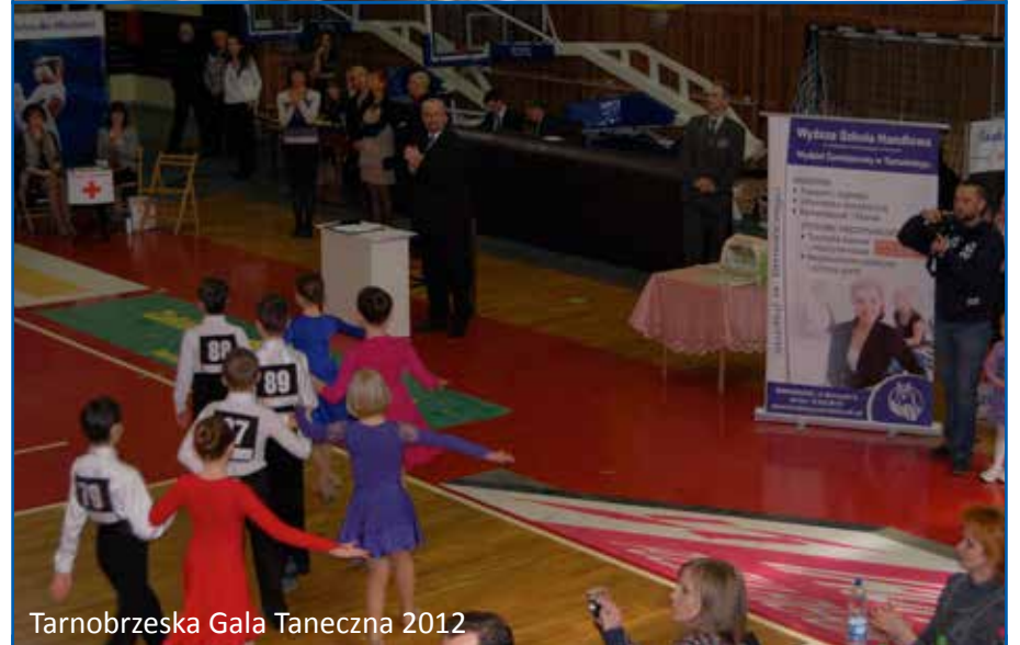
Tarnobrzeczka Gala Taneczna 2012